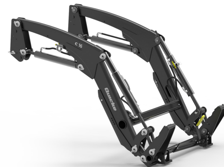
Ładowacze bez samopoziomowania