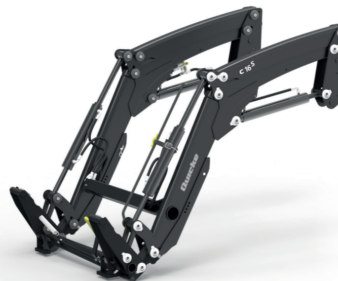
Ładowacze wyposażone w zamopoziomowanie